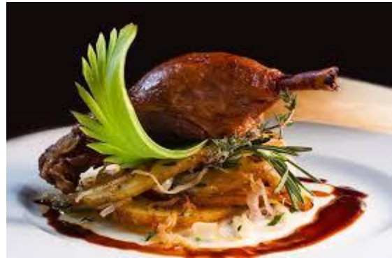
patka u marinadi, pečena