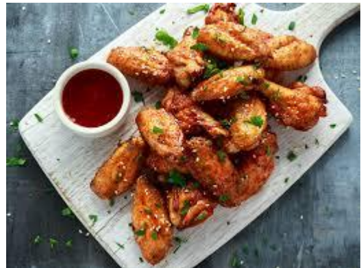
pečena krilca, marinirana