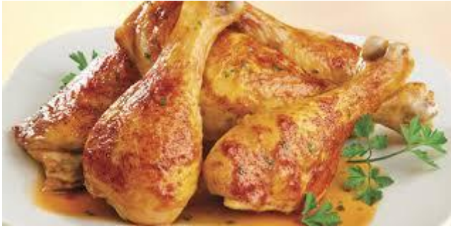
batak i zabatak